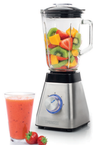
Blender Compact Power 01.212070.01.001

PARTS DESCRIPTION / ONDERDELENBESCHRIJVING / DESCRIPTION DES PIÈCES / TEILEBESCHREIBUNG / DESCRIPCIÓN DE LAS PIEZAS / DESCRIZIONE DELLE PARTI / BESKRIVNING AV DELAR / OPIS CZĘŚCI / POPIS SOUČÁSTÍ / POPIS SUČASTI