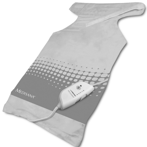
HP 610 Art. 61167