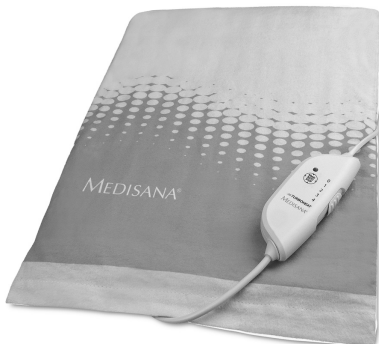
HP 605 Art. 61147

Θερμαινόμενο μαξιλάρι πλάτης και αυχένα HP 610 με κάλυμμα