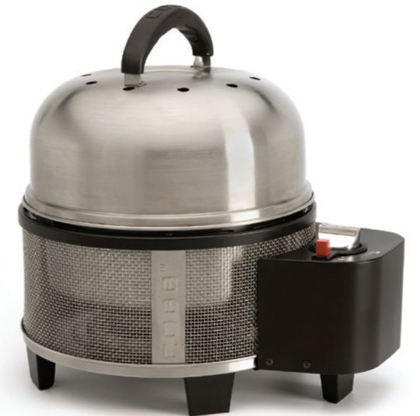
Cobb Premier Gas