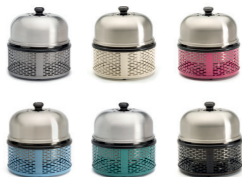
Cobb Pro kleuren

Het basismodel van de Cobb is verkrijgbaar in twee uitvoeringen, de Cobb Premier en de Cobb Pro. Het verschil zit 'm in het uiterlijk. In bouw, werking, veiligheid en gemak zijn de Premier en de Pro helemaal gelijk. De mantel van de Cobb Premier is gemaakt van roestvast staal. Een mooie