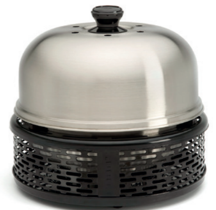
Cobb Pro Compact