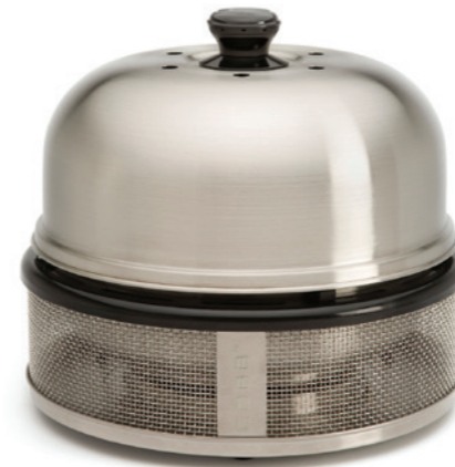
Cobb Premier Compact

Bij deze modellen is optioneel een draagtas verkrijgbaar.