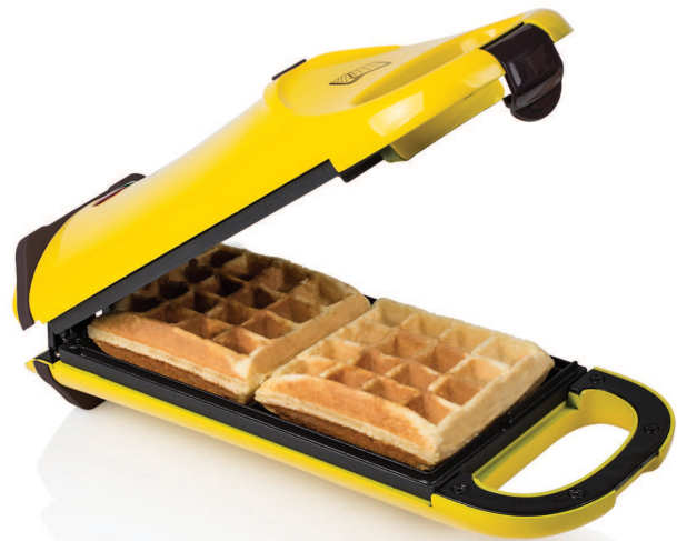
Waffle Maker 01.132400.01.001

PARTS DESCRIPTION / ONDERDELENBESCHRIJVING / DESCRIPTION DES PIÈCES / TEILEBESCHREIBUNG / DESCRIPCIÓN DE LAS PIEZAS / DESCRIZIONE DELLE PARTI / DOS COMPONENTES / OPIS CZĘŚCI / DESCRIZIONE DELLE PARTI / BESKRIVNING AV DELAR / POPIS SOUČÁSTÍ / POPIS SOČÁSTI