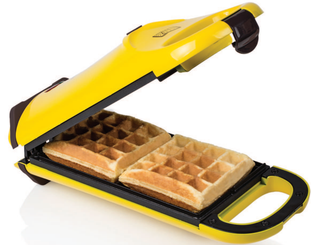
Waffle Maker 01.132400.01.001

PARTS DESCRIPTION / ONDERDELENBESCHRIJVING / DESCRIPTION DES PIÉCES / TEILEBESCHREIBUNG / DESCRIPCIÓN DE LAS PIEZAS / DESCRIÇÃO DOS COMPONENTES / OPIS CZĘŚCI / DESCRIZIONE DELLE PARTI / BESKRIVNING AV DELAR / POPIS SOUČÁSTÍ / POPIS SÚČASTÍ