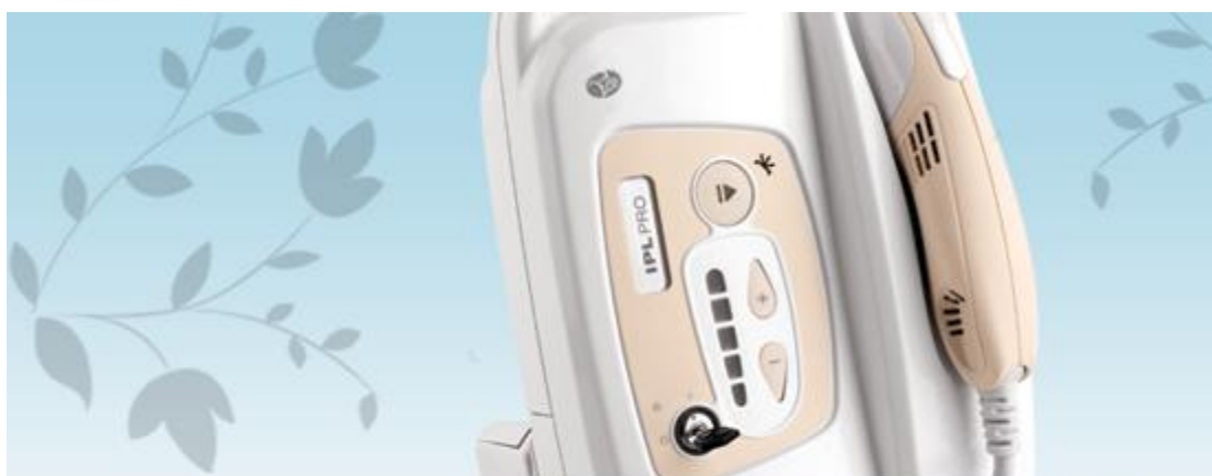
Rio Intense Pulsed Light Hair Remover Pro